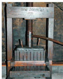
Weinpresse aus dem frühen 18. Jh.