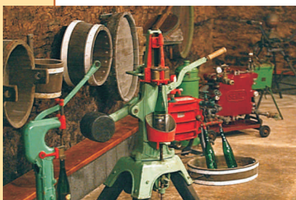
Weinbaugeräte des Weinmuseums